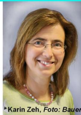
► Karin Zeh

Powerpoint-Präsentation vorgestellt. Nach jedem Block können die jeweiligen Produkte angeschaut und ausprobiert werden. Es wird 5 Praxisblocks geben mit ausreichend Zeit in der Praxis.